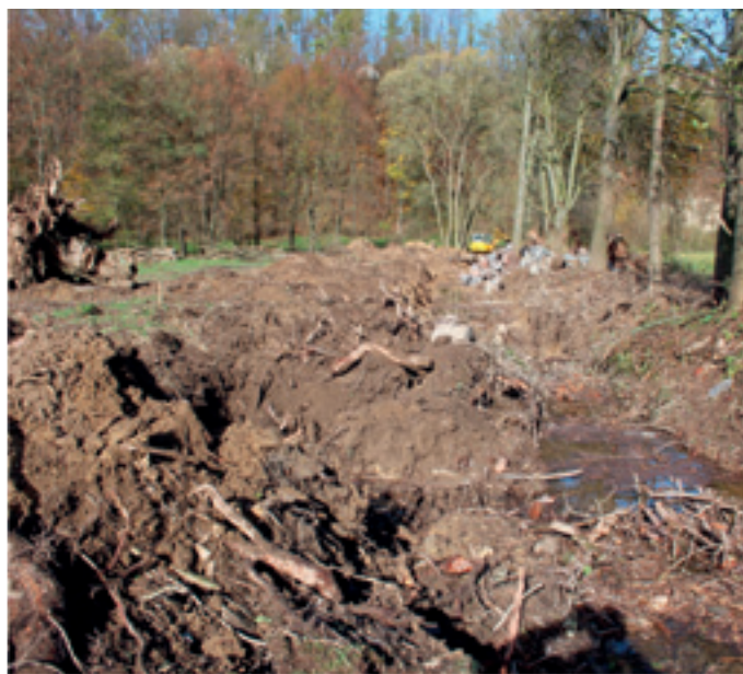
Lubenský potok před soutokem s Desinkou