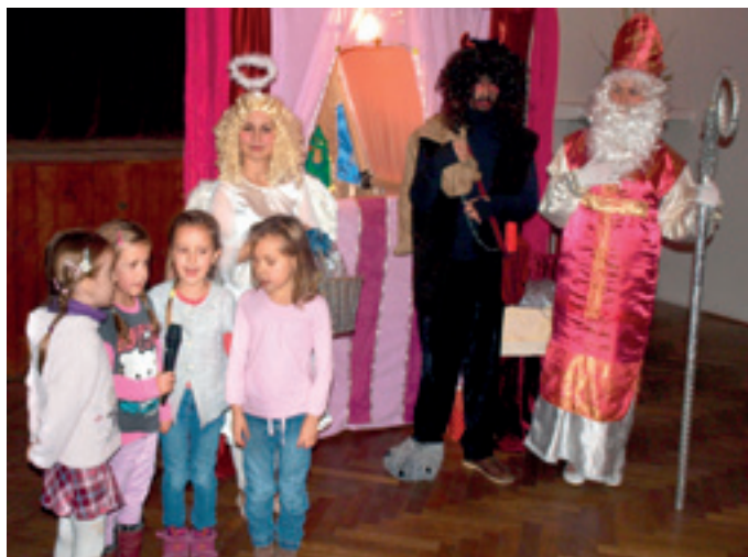
V neděli 6. prosince se v sále kulturního domu konala tradiční Mikulášská besídka. Tentokrát do naší obce zavítalo Divadlo Štaflíčky s pohádkou Princezna a vánoční přání. Po pohádce následovala nadílka pro více než padesát dětí, jako odměna za písničku nebo básničku.