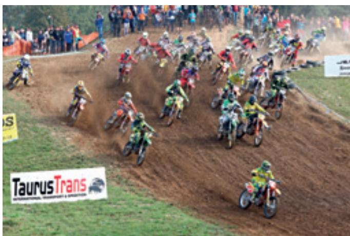
Adrenalin pro jezdce i diváky - nově upravený start.

Letošní motokrosová sezóna v Cikově byla mimořádná. O evropském poháru veteránů ECMO, který se konal v květnu jste se mohli už ve zpravodaji dočíst. Byl to zcela mimořádný podnik, který se vydařil po všech stránkách. Sjelo se 170 účastníků z 19 zemí Evropy, přišlo se na ně podívat téměř tisíc spokojených (doufám) diváků. Spokojený určitě byl holandský promotér seriálu od kterého nám přišlo poděkování. Po tomto mezinárodním úspěchu jsme se s maximálním nasazením pustili do příprav na další podnik, kterým mělo být Mezinárodní mistrovství ČR v motokrosu BUKSA ADOS cup. Pro větší bezpečnost jezdců i diváků a zároveň pro ztraktivnější trati v Cikově jsme se rozhodli upravit start což mělo za následek změnu směru jízdy. Celá tato velice náročná akce se podařila a trať byla připravena na vrchol sezóny. Ovšem počasí bylo proti. Letošní extrémně suché léto a zákaz odběru vody z povrchových zdrojů nám nedovolily v termínu 23. srpna tyto závody uspořádat. Se stejným problémem se potýkalo více pořadatelů v republice a docházelo ke značným termínovým posunům, což nám možná trochu pomohlo a my byli pověřeni pořádáním MMČR v motokrosu družstev, což je vrchol české motokrosové sezóny. Tohoto podniku, který se uskutečnil 4. října se zúčastnilo 22 družstev a ve vloženém závodě, který se započítával do MMČR juniorů se představilo dvacet jezdců třídy 80 ccm. Před televizními kamerami a téměř dvěma tisícovkami diváků jezdci sváděli souboje při kterých se tajil dech. Vlastní