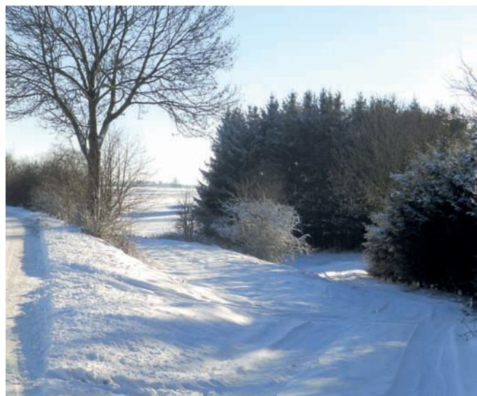
Zimní krajina v minulých letech.