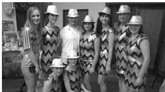
Letošní obecní ples zpestřila svým předtančením s názvem Miss Jackson skupina Bailadoras.