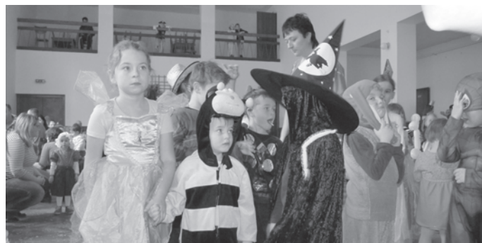
Poslední únorovou neděli ožil sál kulturního domu dětmi v karnevalových maskách.