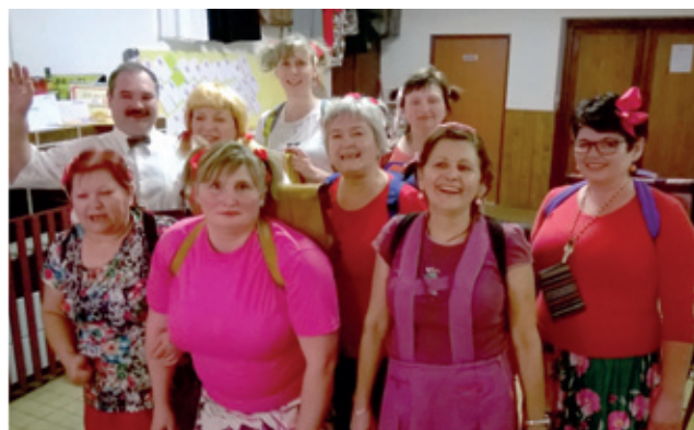
Půlnočním překvapením pak bylo vystoupení žákyň s aktovkami, které svoje vystoupení, nazvaly „Třetí třída artritida“.