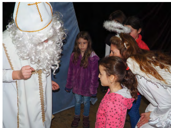
PRVNÍ PROSINCOVOU SOBOTU JSME V KULTURNÍM DOMĚ OSLAVILI MIKULÁŠE S DIVADLEM MoPeADD, KTERÉ SEHRÁLO POKHÁDKU „MIKULÁŠ NA CESTÁCH“.