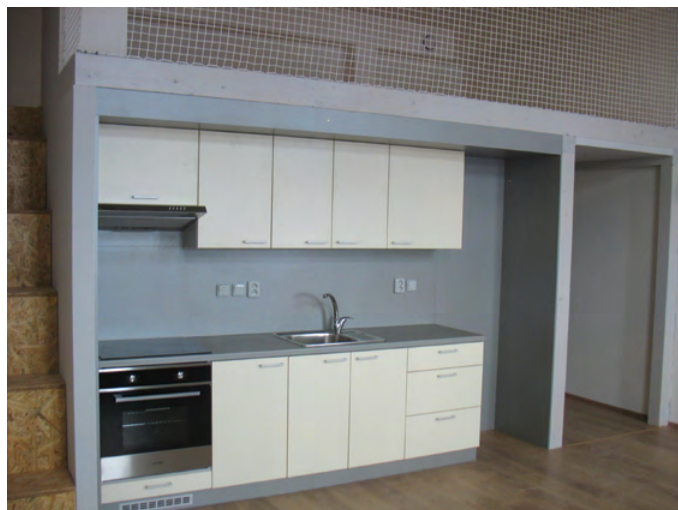
NOVÁ BYTOVÁ JEDNOTKA – VLEVO MLYNÁŘSKÉ SCHODY PRO VSTUP NA GALERII.

Každopádně, to, že kolaudační řízení proběhlo téměř bez připomínek, je velkou zásluhou firmy Stavitelství Jokeš, že vše zvládli takto rychle a kvalitně; vestavbu 8-mi bytových jednotek provedli prakticky během 10-ti měsíců. Zde pro jistotu připomínám, že rekonstrukce objektu bývalé ZŠ měla dvě etapy. Ta první – vestavba